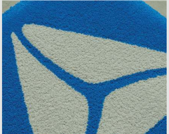
Ровная стрижка ворса