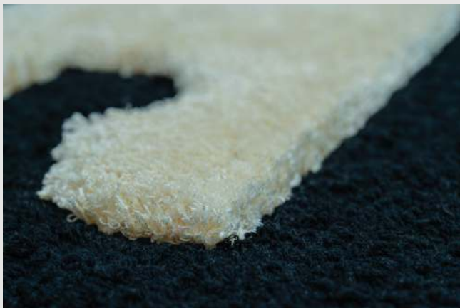
Многоуровневая стрижка ворса