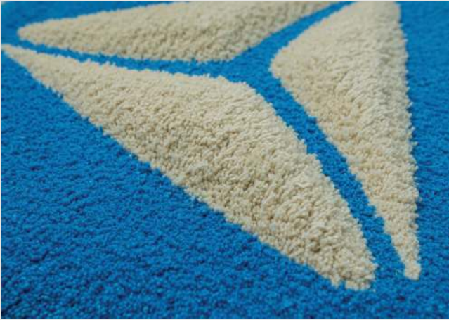
3D стрижка ворса