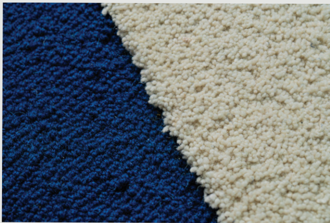
ჩახვეული ქსოვა (ენ „Loop cut”)