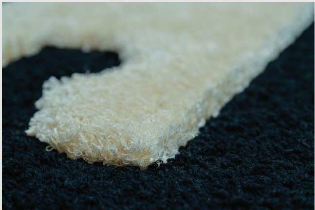
მრავალ დონიანი ქრა